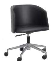
800 BC (C) 800 BC (N)