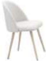
700 FPM (N) 700 FPM (B)