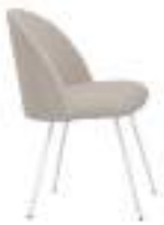
700 F (N) 700 F (B)