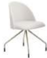
700 4 C/T (N) 700 4 C/T (B)