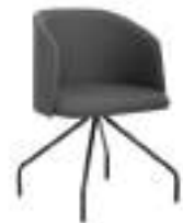
800 4 C/T (N) 800 4 C/T (B)