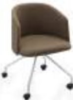
800 4 C/R (N) 800 4 C/R (B)