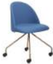
700 4 C/R (N) 700 4 C/R (B)