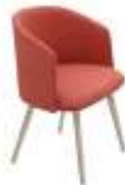
800 FPM (N) 800 FPM (B)