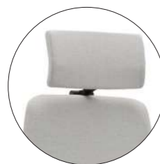
CABECERO (RXY) HEADREST (RXY)

Careful static design with seat and back interiors in laminated wood and ergonomically postformed, facilitating lumbar, dorsal and pelvic support and flexible polyurethane foam with an average thickness of 5 cm and suitable densities. It allows incorporating in its options the Trasla mechanism to regulate the depth of the seat, the RVL to regulate the lumbar volume with an easily accessible rotating wheel on the side of the backrest (which is added to the height adjustment of the backrest that it incorporates as standard). It will also be possible to incorporate the new SHIFT SYSTEM® that allows the user to be accompanied in all his lateral and rotary movements independently.