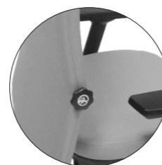
REGULACIÓN LATERAL DEL VOLUMEN LUMBAR (OPCIÓN) LATERAL REGULATION OF LUMBAR VOLUME (OPTION)