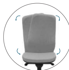
SISTEMA SHIFT® EN RESPALDO Y ASIENTO (OPCIÓN) SHIFT SYSTEM® IN BACK AND SEAT (OPTION)