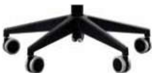
Base poliamida pirámide negro con ruedas de 65 mm. (estándar)

Elija su base de 5 radios / Choose four 5 spoke base: