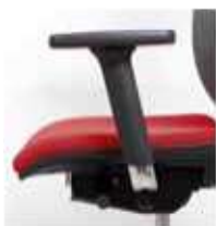
C/B-7 Brazos regulables en 4 dimensiones (altura, adelante/atrás y giro) en aluminio pulido