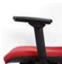
C/B-5 Brazos regulables en 3 dimensiones (altura, adelante/atrás y giro) en poliamida color negro