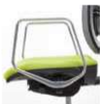
C/B-8 Brazos en aluminio pulido