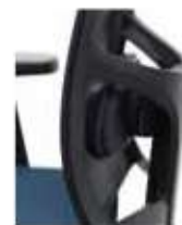
Regulación del volumen lumbar Lumbar support adjustment