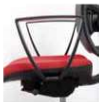
C/B-1 Brazos fijos de poliamida color negro

Elija los brazos que desee para la silla / Choose the desired armrests.