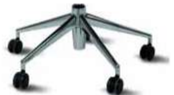
Base de aluminio Compas Pulida con ruedas de 65 mm.