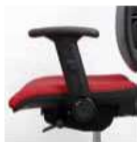
C/B-3 Brazos regulables en altura y abatibles lateralmente