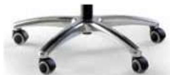
Base de aluminio Pulida 1 con ruedas de 50 mm.