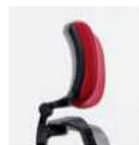
Cabezal basculante tapizado Upholstered tilting Headrest