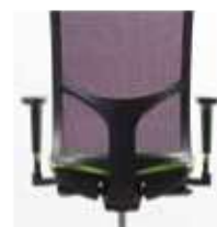
Up-Down. Regulación altura respaldo Height adjustable backrest