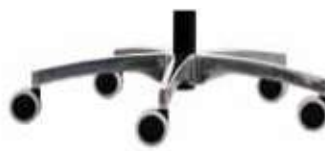
Base de aluminio Pulida 2 con ruedas de 65 mm.