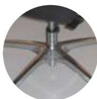
Pistón cromo base pulida