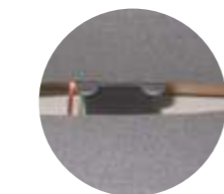
Detalle conducción de cableado especial