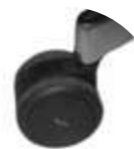
Ruedas 65 mm antiestática