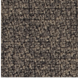
TStep Melange • 61103