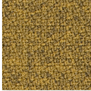
TStep Melange • 62057