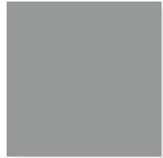
Gris RAL 7012