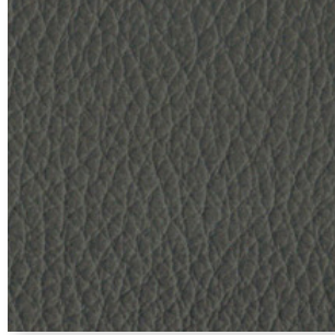
Piel · 121 · Gris