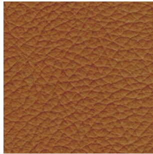
Piel · 142 · Potro