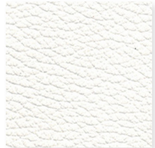
Piel · 179 · Blanco