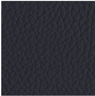
Piel · 114 · Azul