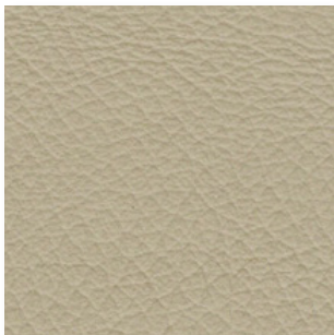
Piel · 102 · Arena