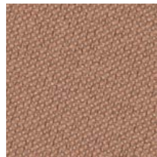
Just · 63094