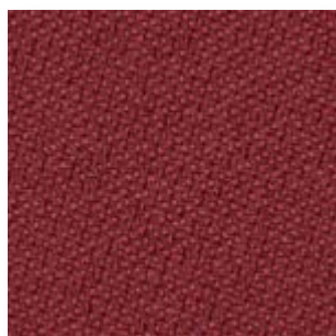
Just · 64206