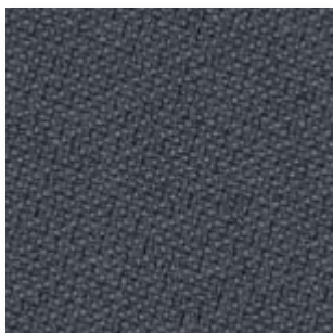
Just · 60119