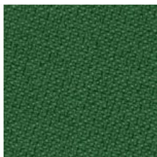
Just · 68201