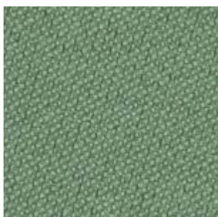
Just · 68200