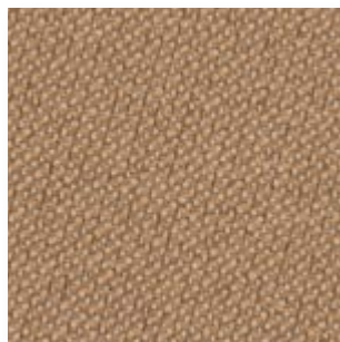
Just · 61178