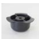
Pata de Nylon negro 30 mm