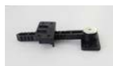
Herraje de unión