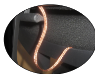
Detalle conducción de cableado especial