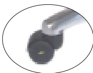
Rueda 50 mm antiestática