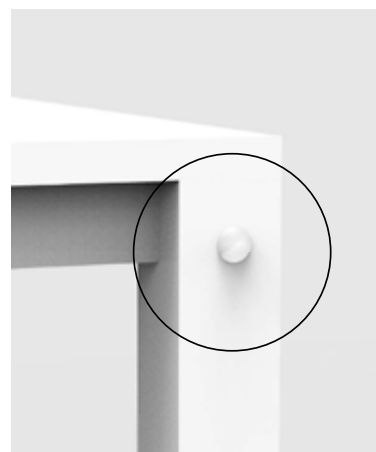
KUA - K