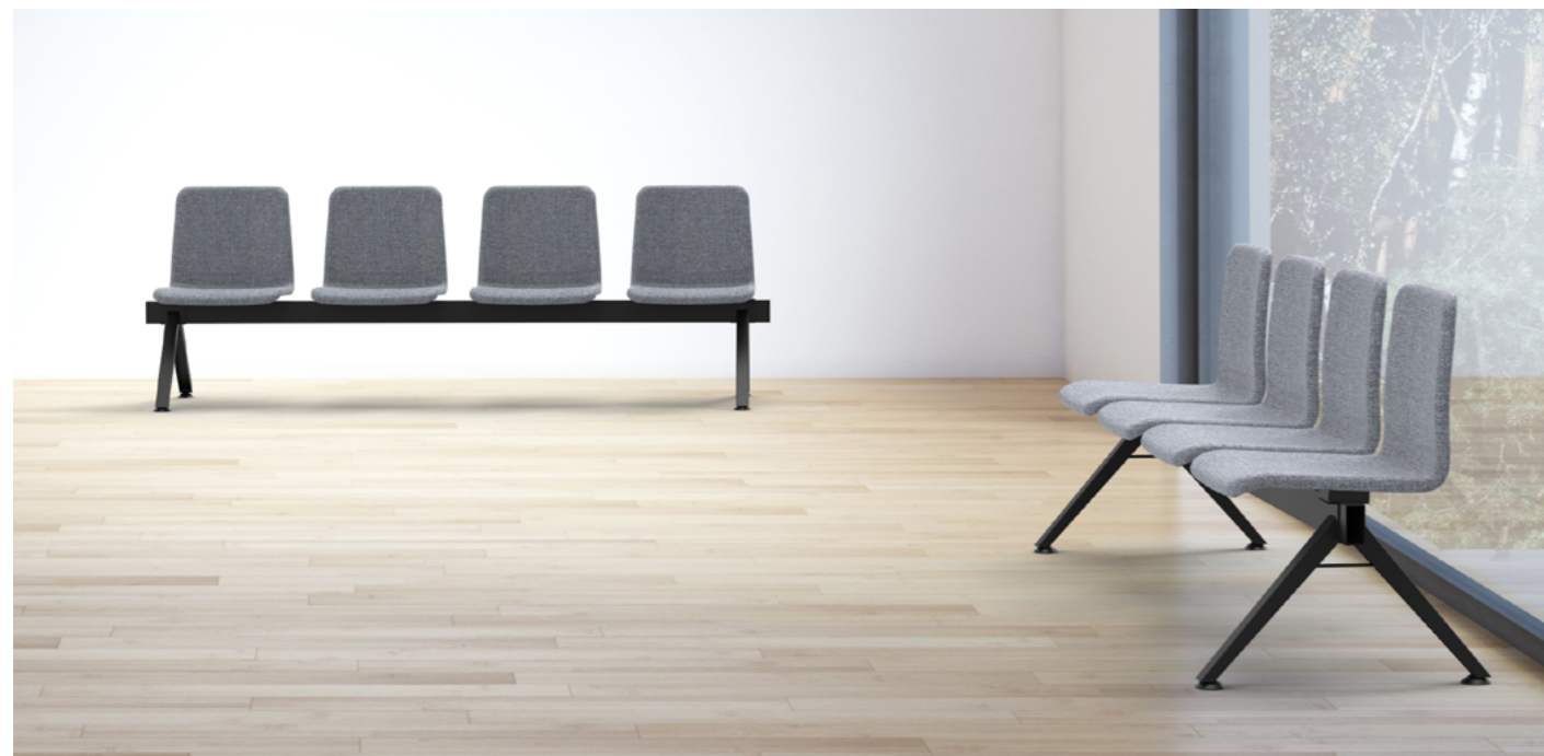
Bancada Wing de cuatro plazas y patas Uve.

Las sillas de la colección Wing pueden ser tapizadas en cualquiera de los tejidos incluidos en el muestrario de delaoliva , incluso en tapicerías adecuadas aportadas por el cliente.