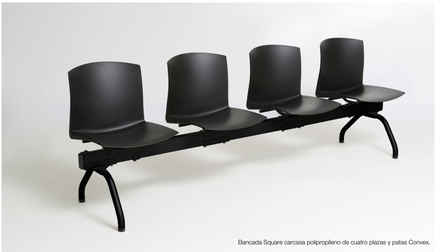
Bancada Square carcasa polipropileno de cuatro plazas y patas Convex.

Las sillas de la colección Square pueden ser tapizadas en cualquiera de los tejidos incluidos en el muestrario de delaoliva , incluso en tapicerías adecuadas aportadas por el cliente.