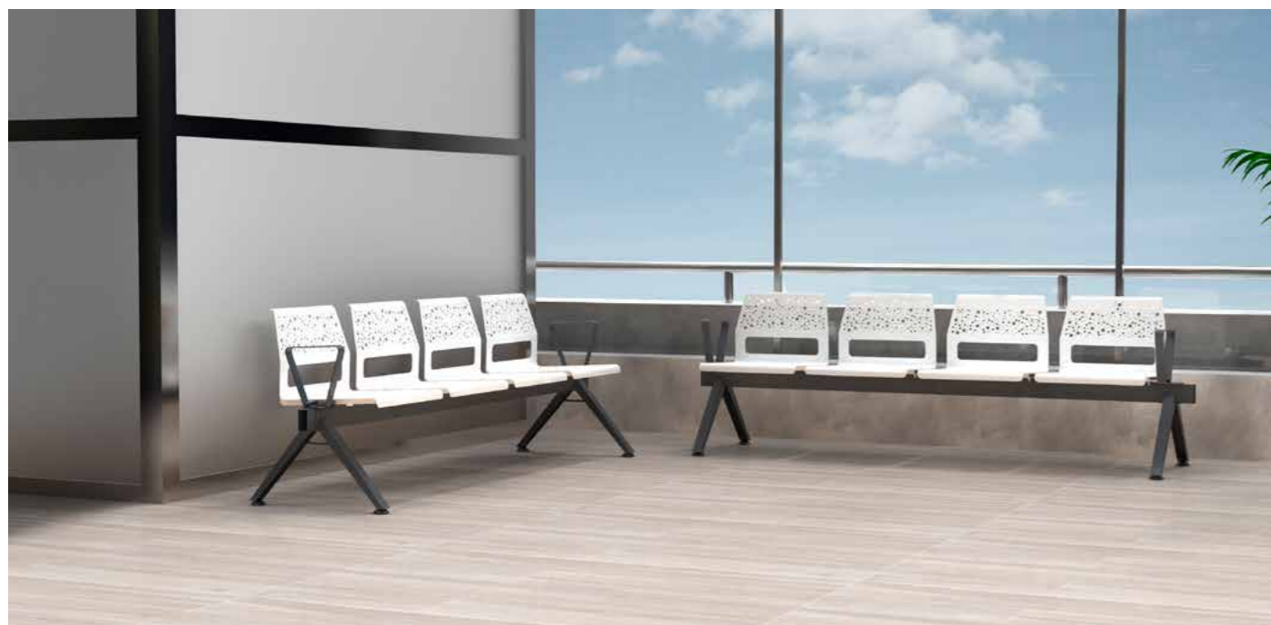
Bancadas Dots de cuatro plazas y patas Uve.